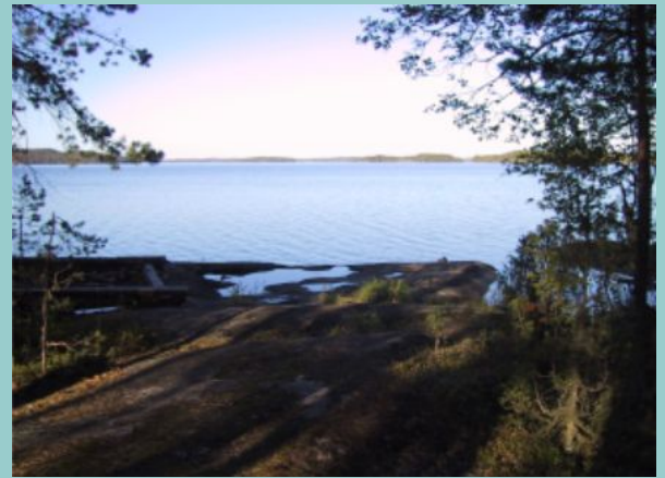
Luonteria kauneimmillaan.