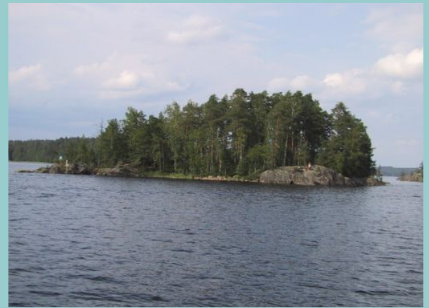
Jantinsaari, pieni saari matkanvarrella Anttolaan.