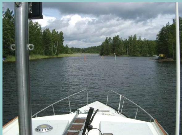
Kapea reitti jatkuu kohti Suur-Saimaata.