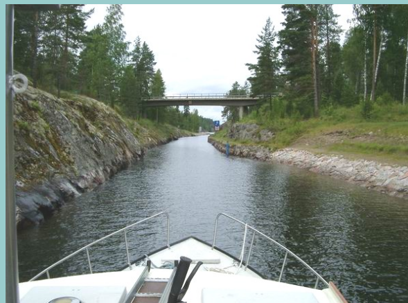
Varkaantaipaleen upea kanava.