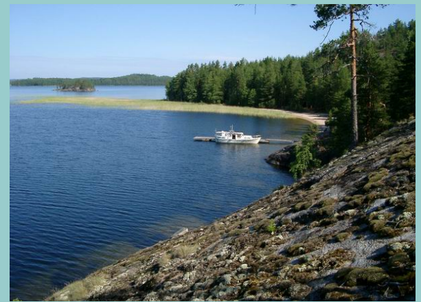
Karihiekkan rantaa kelpaa kulkea.