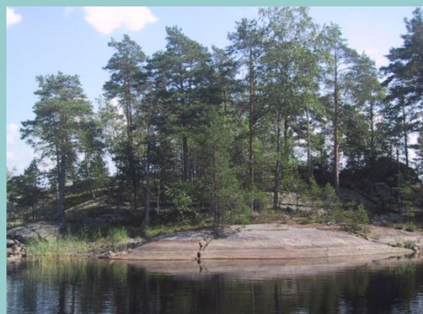
Yksköytisen satamassa on hyvä kallio.