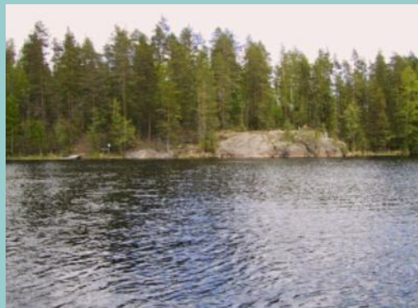
Kaijatsaari, helppo rantautua isommallakin veneellä.