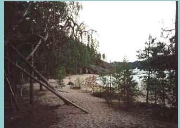
Karihiekkä. Hiekkaranta erämaassa.