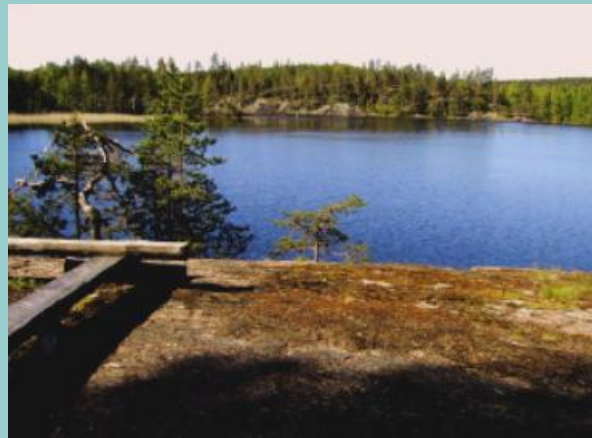
Näkymä nuotiopaikalta aamuauringon peittämään Pappilansalmeen.