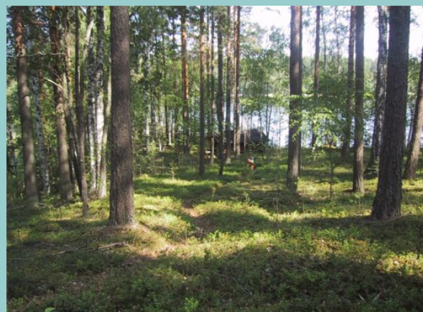
Upea metsikkö tarjoaa syksyisin syötävää rajattomasti.