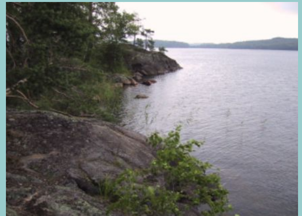
Jyrkät rannat ovat tämän saaren tunnuspiirre.