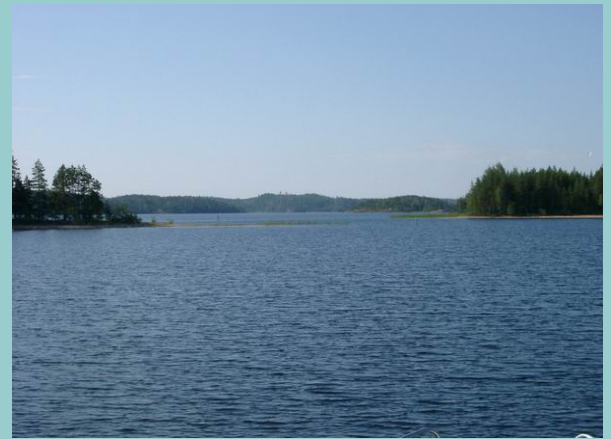
Raintasaaren retkisatama Luonterilla